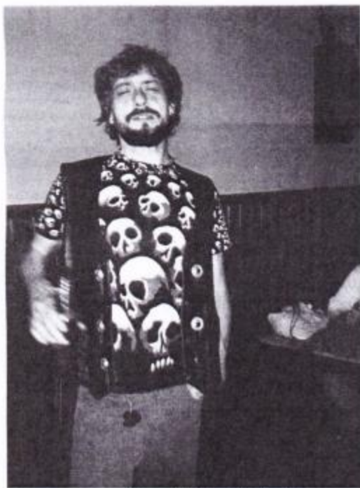
El personaxe más gamberru de Cellero. (L. VENTURA)

—Carreño sofita muncho más la cultura porque tienen una trayectoria de más de 30 años que ta rellacionada col movimientu ciudadanu. En nada voi representar al Lazarillo (el 8 y 10 de payares) nel Teatru Prendes (Candás).