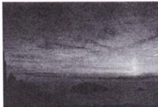
Los coloraos primen en cielu na puesta de sol. (E. P.)